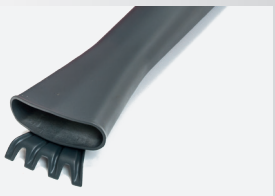
Integroitu kaavin - poistat helposti märät ja liimaantuneet lehdet.