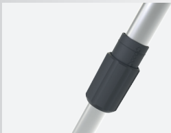
Teleskooppirungolla säädät yksilöllisen työskentelykorkeuden.