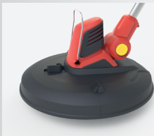
CCM - täysin suljettu leikkuupää.