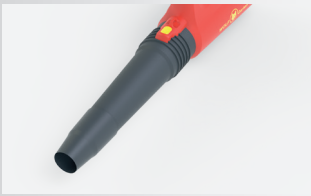
Lyhyellä putkella maksimi ilmanopeus