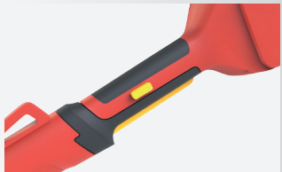
Pehmeä kahva lisää mukavuutta.