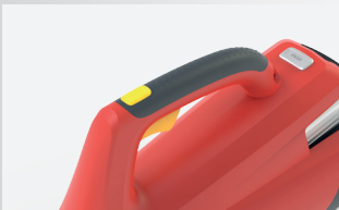
Pehmeä kädensija, turbo-asento tuo lisää tehoa, 36V asennolla säästät akkua. Helppo vaihtaa napin painalluksella.